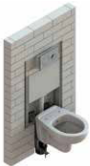
Ένθετο σε τοίχο