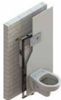
Επίτοιχο με επένδυση γυψοσανίδας