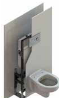
Αυτοσπόμετο, με επένδυση γυψοσανίδων